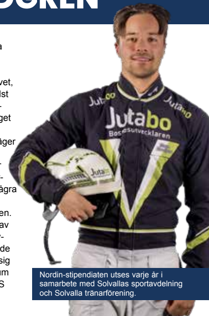
Nordin-stipendiaten utses varje år i samarbete med Solvallas sportavdelning och Solvalla tränarförening.