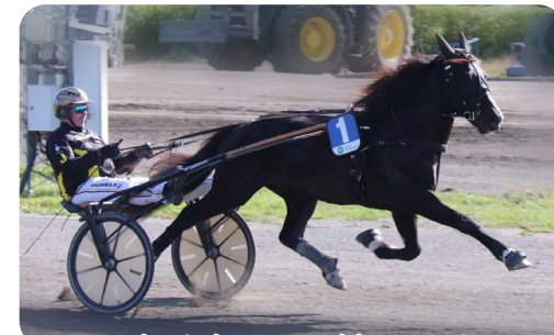
Dundertalang med hyperstam!