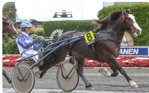
Dubbel Kriterievinnare - en kanon!