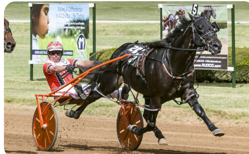
Otroligt spännande - rek. 1.06,5!