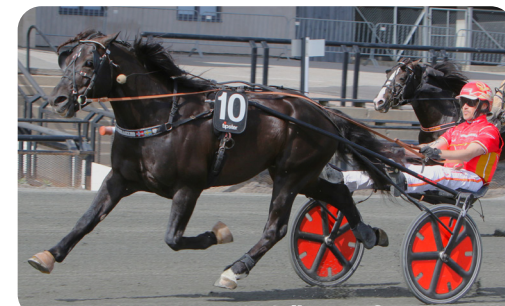
En av rasens bästa nånsin!