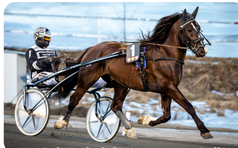
Brutal avelsdebut - passar "allt"!