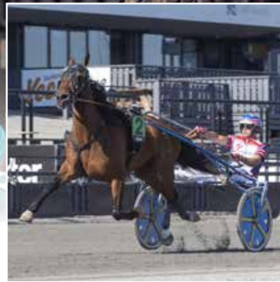
OMSLAGSBILD: Ble du Gers.

TVILLING TVILLING går ut på att hitta de två hästar som är 1:a och 2:a i mål i ett lopp, oavsett ordningsföljd. Vilken av de två främsta hästarna som kommer först i mål spelar alltså ingen roll. Tvillingoddsen anger utdelningen per satsad krona/kombination.